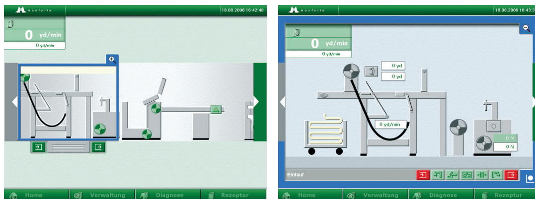
Bild 2. Vektorbasiertes Interface für Monforts-Maschinen – Detailansicht nach Bedarf (rechts)